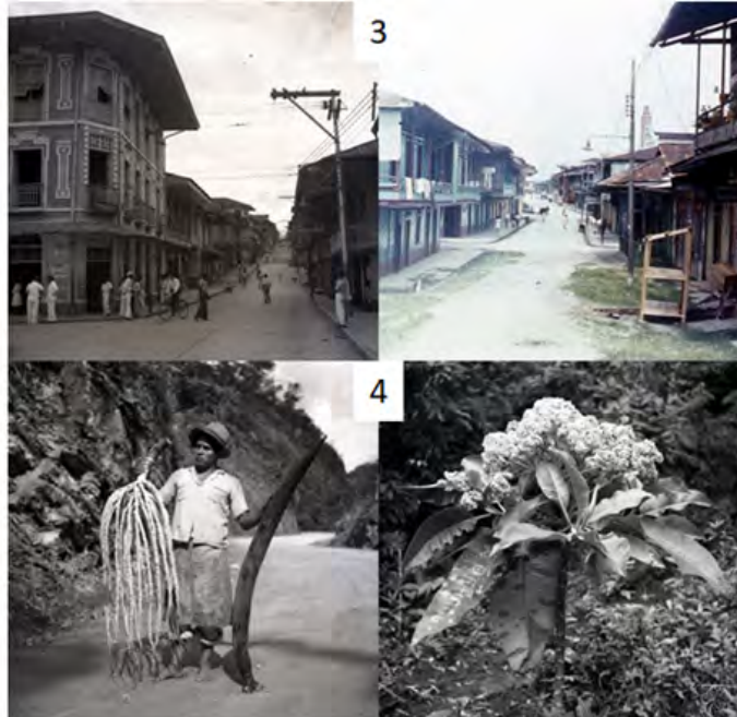
Figura 3. Izq. Buenaventura. Entrada a la calle principal, con el Palacio Municipal (esquina, edif. izq.), y la farmacia del Dr. Ablanque (esquina, der.) (Foto I-1515, 19/2/46). Der. Calle de Buenaventura (Foto K-109; 19/11/45). Figura 4. Izq. Carretera al mar, Rioblanco, 340 msnm. Ignacio (ayudante) sosteniendo un racimo florecido y un capullo de inflorescencia de una palma Socratea (No. 24012) (Foto I-1985; 29/3/47). Der. Subiendo a los Farallones de Cali, en el Almorzadero (2920 msnm), Senecio silvani typus (no. 21.698). Inflorescencia terminal del arbolito no ramificado y erguido; tallo 10 cm de diám.; corteza verde, madera blanca ocrácea, radios muy marcados; médula blanca blanda (Foto 1681; 24/7/46).