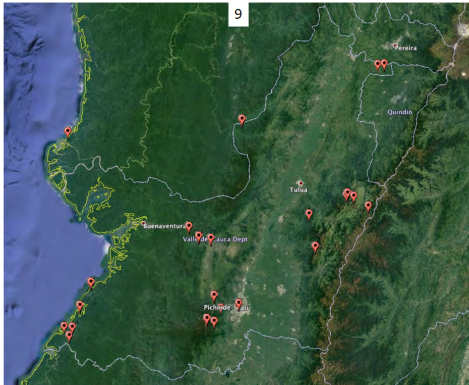
Figura 9. Lugares de principales expediciones de José Cuatrecasas Arumi en el Valle del Cauca (años 1942–1975).