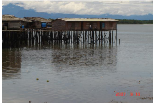
Asentamiento poblacional del municipio, zonas periféricas en el barrio la Playita calle la Punta del Caco