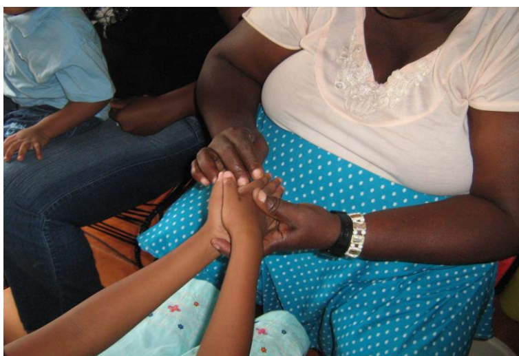
Mujer Curandera diagnosticando el mal de ojo en una menor de edad.

La mayoría de los entrevistados correspondientes a este tipo de agente tradicional, son provenientes de la zona rural de Buenaventura, o en lo sucesivo de los ríos circunvecinos que abarcan la costa Pacífica colombiana, su nivel educativo es la primaria incompleta, tiene más de 35 años de edad y, su experiencia en este oficio supera los 10 años, profesan la religión católica; en este campo se desempeñan, tanto mujeres como hombres. Para Buenaventura exclusivamente, las mujeres curanderas, “las cujapas” son muy reconocidas por su comunidad, pues tratan las enfermedades como el ojo y el espanto, padecidas regularmente por muchos niños.