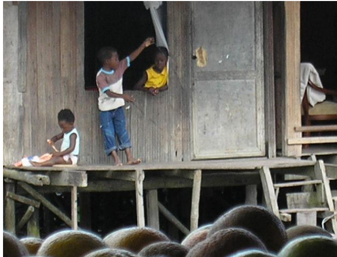
Vivienda del barrio Bellavista, calle Pampalinda

Los datos estadísticos referidos a la población estimada en Buenaventura para el primer decenio del 2000 18 solo son aproximaciones; se contaba con una población de 237. 585 habitantes en el 2004 y por otro lado el DANE estima que para el año 2005 hubo una población de 278.969 habitantes, de los cuales el 85.8% vive en la cabecera municipal y el 14.2% restante vive en la zona rural, esto indica que hubo un crecimiento anual en la población de 41.384 habitantes.