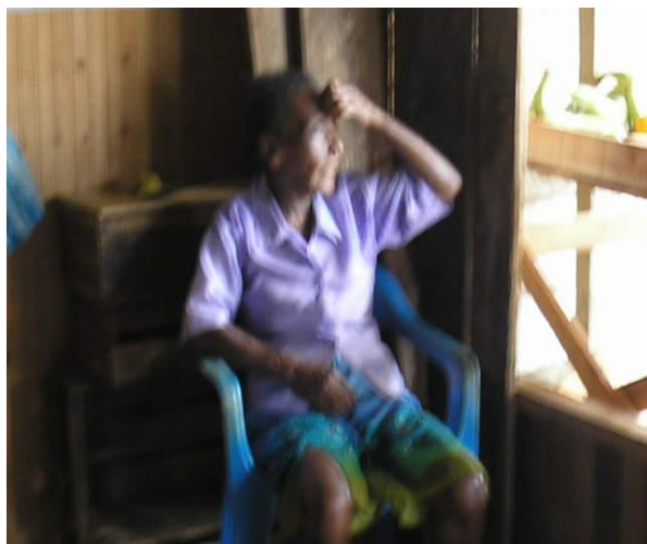
Mujer partera en la ventana de su vivienda pendiente de la venta de productos