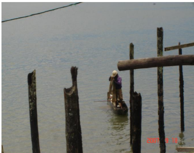
Hombre pescando en el puente de la Calle Punta del Caco barrio la Playita

Buenaventura tanto en su zona rural como urbana, ha tenido una serie de características y aspectos muy homogéneos, relacionados con la cultura, la mayor parte de la población se identifica con expresiones artísticas similares, entre ellas está la oral, musical, y la danza; en cuanto a su parte gastronómica, cuenta con unos platos típicos y exóticos que son producto del mar y que sin duda han sido por muchos años el punto de atracción de propios y extraños.