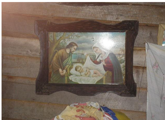
Imagen de la Sagrada Familia ubicada en una de las paredes de la casa de una mujer agente tradicional de salud. Barrio Bellavista

Generacionalmente, algunas de las concepciones relacionadas con la religiosidad y la espiritualidad, tienen su raíz en la creencia de un ser supremo que rige toda su cotidianidad, es decir, todo cuanto se realiza es gracias a las obras y las influencias positivas que este ser pone en el individuo.