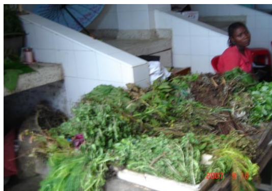
Mujer hierbatera al pie de su puesto de ventas en el Centro de Acopio de barrio la Playita.

La hierbatera, conocida comúnmente como yerbatera , es otro tipo de agente, y se dedica exclusivamente a la comercialización de plantas aromáticas, condimentales y medicinales que sirven para curar enfermedades, hacer purgantes, baños, consumo de aromáticas, tiene un conocimiento amplio del uso y efecto que tienen no solo las plantas sino las cortezas de los árboles, las hojas, semillas; reconocen la clasificación de plantas calientes y frías, dulces y amargas.