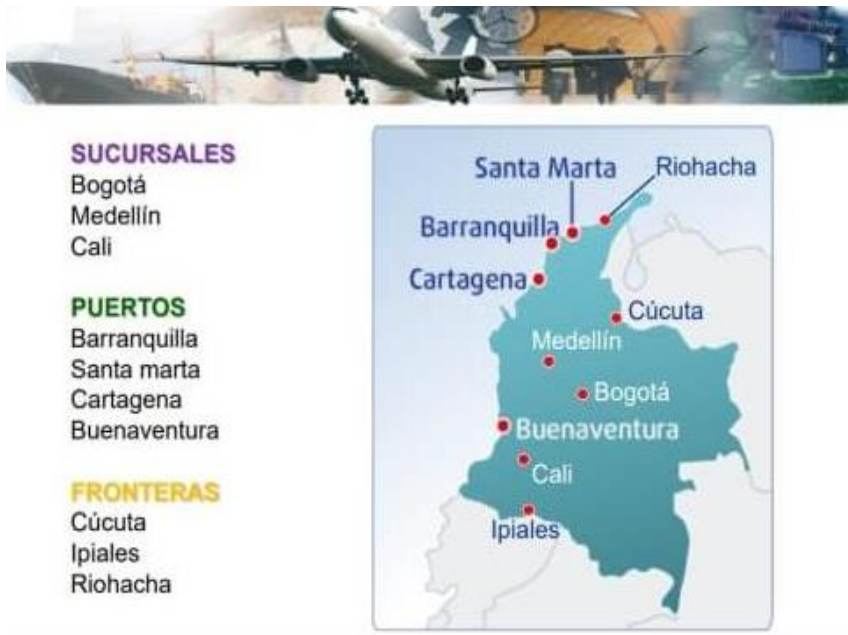
Ilustración 2. Ubicación Geográfica grupo Aviatur