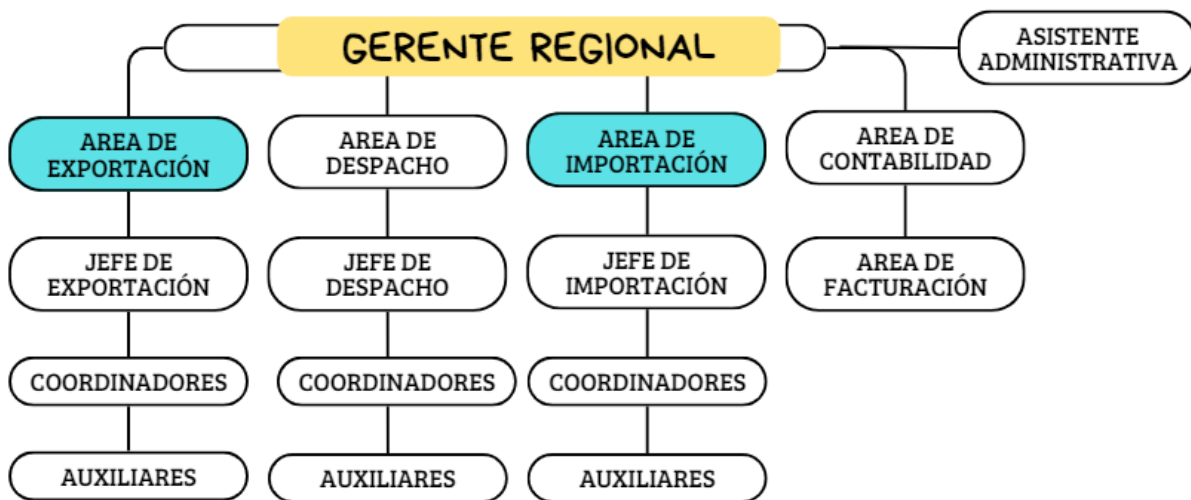
Ilustración 4. Organigrama de la Agencia de Aduanas Aviatur Nivel-1 sede Buenaventura.

El diagrama organizacional previo refleja de manera precisa al grupo de expertos que actualmente colaboran estrechamente en la seccional de Buenaventura.