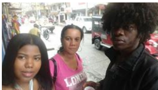
Foto 1. Habitante de la calle en Buenaventura