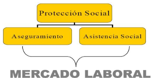
Ilustración 1. Componentes del Sistema de la Protección Social.

pero no necesariamente propicia procesos de estabilización y acumulación de capital humano, físico, financiero y social más propia de la protección social. Guerrero (2006) manifiesta que el Sistema de Protección Social en Colombia se centra en dos objetivos principales (ver ilustración 1), el primero de ellos es proteger a toda la población de los riesgos económicos, ello lo hace a través del aseguramiento (seguridad social). El segundo objetivo busca asistir a la población más pobre a fin de que puedan superar su situación en el corto y largo plazo, este se lleva a cabo a través de la asistencia social.