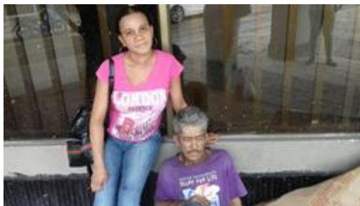
Foto2. Habitante de calle en Buenaventura