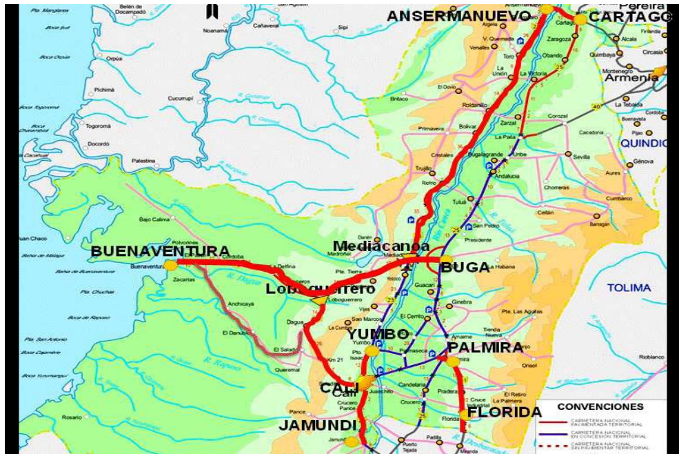
Mapa 2. Ubicación del proyecto doble calzada Buenaventura – Buga

importante del sistema económico mundial, esto por su ubicación geoestratégica en el llamado mar del siglo XXI.