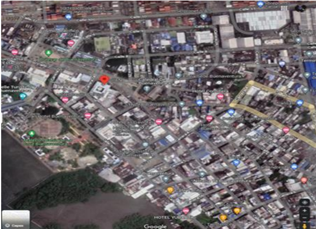
Ilustración 2: La Dirección de Impuestos y Aduanas Nacionales– DIAN cuenta con una sede en Buenaventura valle del cauca la cual está ubicada en la zona céntrica de la ciudad, a 2a-52, Cl. 3 #2a2.