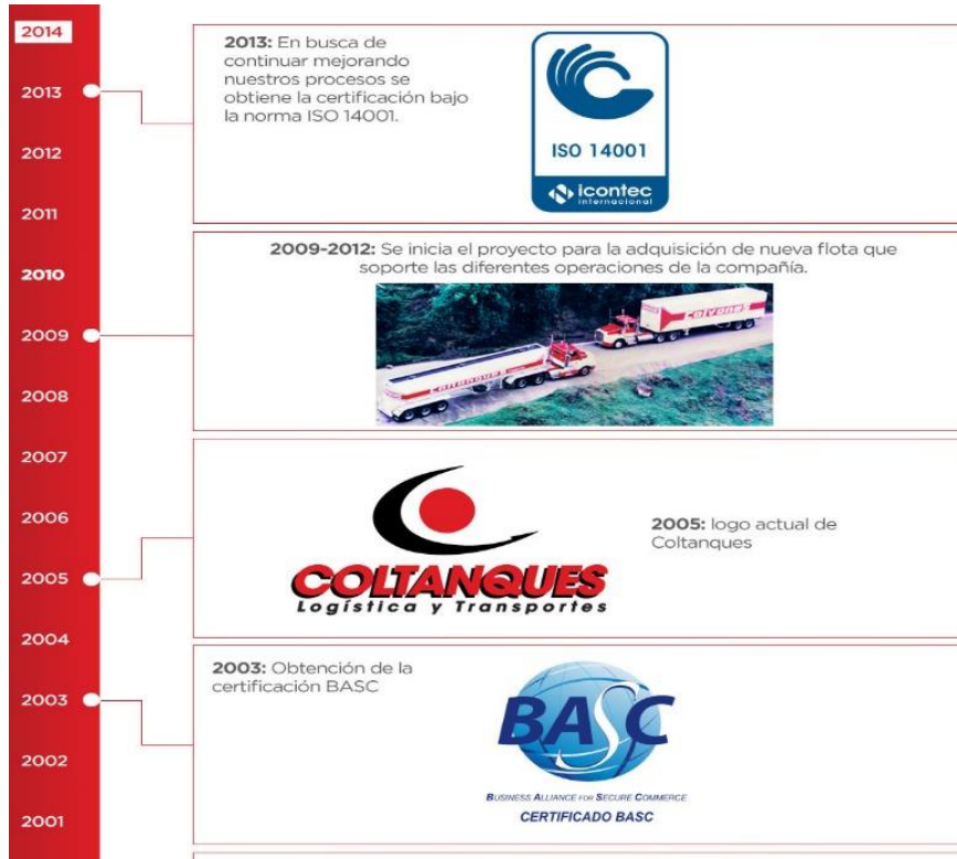
Ilustración 1.1: Reseña Histórica