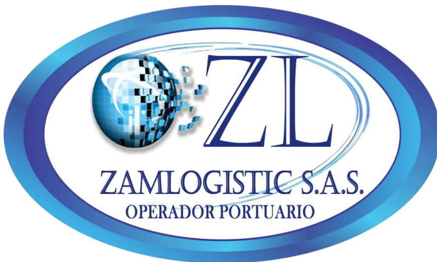
Ilustración 1: logo de ZAM LOGISTIC SAS