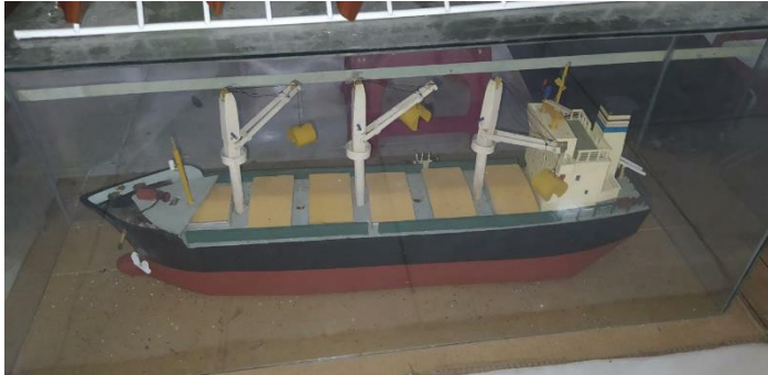
Ilustración # 1: Barco A granel