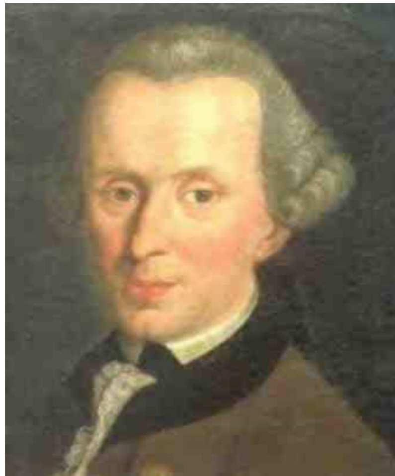
Fotografía. Emmanuel Kant

El comportamiento humano está sujeto a cometer errores, por lo que no se debe juzgar dicho comportamiento por sus consecuencias sino por la motivación ética.